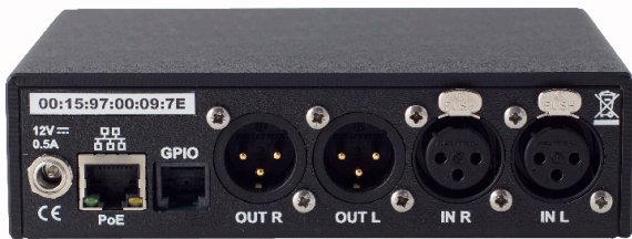
Version analogique et POE

Léger et compact (Format 1/3 de 19"), \mu Scoop trouvera idéalement sa place dans des infrastructures légères nécessitant d'établir des transmissions IP de qualité professionnelle.