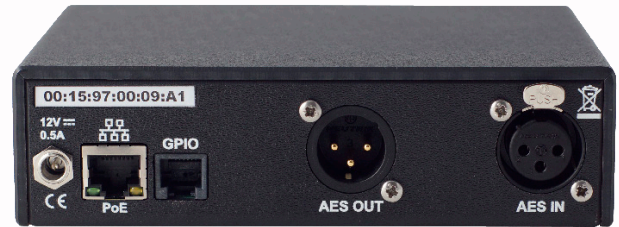
Version numérique et POE