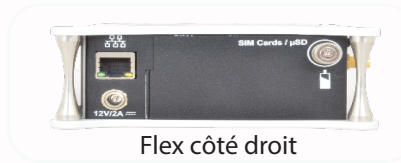
Flex côté droit